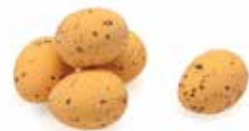
Abrikoos / Apricot / Abricot