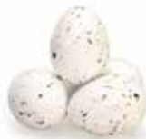
Wit / White / Blanc

Praliné omhuld met suiker / Sugar coated praline / Praliné enrobé de sucre 30-32 mm x 22-24 mm / ± 90 st/kg