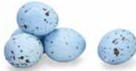
Blauw / Blue / Bleu