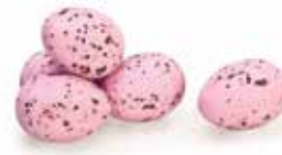
Roos / Pink / Rose