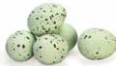
Groen / Green / Vert