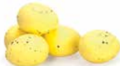
Geel / Yellow / Jaune